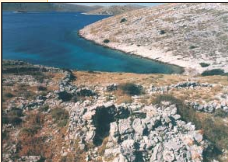
Slika 16. Ostaci stočarskog stana sa staninom i popratnim mirinama na otoku Kornatu

ne mora do nadmorske visine od više stotina metara. Takvi prostori okruženi su zidovima različite debljine — od jednostrukih do nekoliko desetaka metara širokih, visine od jednoga naslaganog reda kamenja do 6-7 metara. Svima je zajednička namjena da se obrani i zaštiti ono što je ograđeno i onaj tko brani. Iz te »šume« različitosti po različitim kriterijima izdvojili smo najmarkantnije ograđene prostore, koji se međusobno razlikuju funkcijom, starošću, namjenom ili nekom drugom osebujnošću.