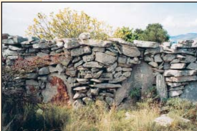
Slika 7. »Interpolirani« zid

nižim dijelovima stariji je od obično bolje obrađenoga kamena (vezanog žbukom ili ne) na što je nadzidan ili dozidan mlađi dio mahom od slabije obrađenog ili potpuno neobrađenog, neuredno slagana kamena. Takvi zidovi u pravilu kriju dio građevine iz dalje prošlosti. Obično takva mjesta prate odlomci keramike. Prema načinu gradnje i veličini kamenih slojevito položenih blokova (k) može se donijeti približan sud o vremenu i važnosti stare gradnje.