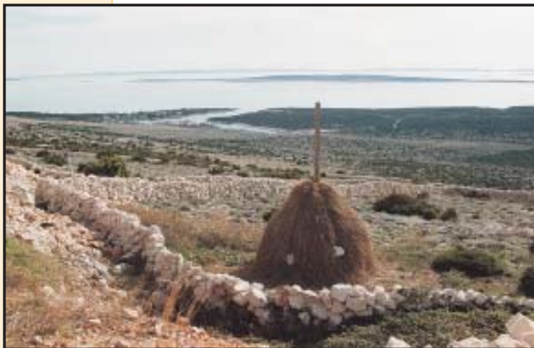
Slika 1. Jednostruki obični zid

Iz izreke starca (oko 1946) u Kotarima o stoci lijepo se razabire vrijeme, imovinsko stanje, nazire kvaliteta prostora i potrebna visina ogradnih zidova: »od kože se priživljava i muči (šuti), od ovce žive, a sa konjun i volun se fali«. Za kozu je potrebna najviša visina zida. Ograde ni prostor je oskudan i dragocjen (šuti se i trpi) jer je i siromaštvo najveće. Uzgoj ovce (»od koje žive«) upućuje na približnu ravnotežu vrijednosti stoke i zemlje, odnosno na prijelaznu fazu promjene težišta sa stočarenja na agrar. Ogradni zid za ovcu je niži, a gospodarenje je kombini-