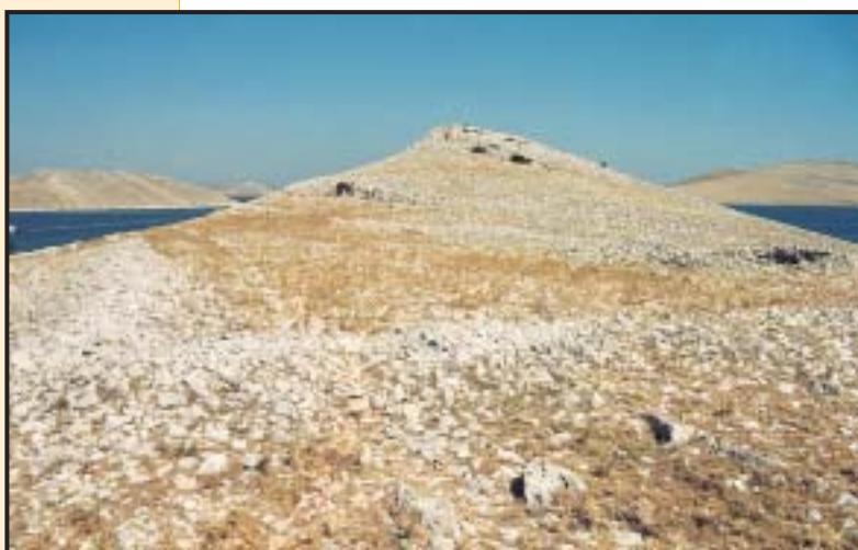
Slika 19. Prastara devastirana, jedva zamjetna ograda na otoku Svršati u Kornatima

je o vrsti i proporciji uzgajane stoke (koza — drvolika vegetacija gariga i makije, ovca — travnati kamenjari i razvijena drvolika vegetacija). »Veliki torovi ili stanine« su jedna od prvih posljedica inovacija kapitalističkog načina stočarenja u feudalizmu. »Latifundijskim« načinom gospodarenja na iznajmljenim »otvorenim pašnjacima« velika stada čuvaju preko »bravara« ugovorom vezani »profesionalni« pastiri često iz vrlo udaljenih krajeva. Za njih je karakteristično da se nalaze »posijani« po kršu na lokacijama u prvom redu zaštićenim od vjetra. Njima najbliže smještene »usuho« zidane građevine su »eliptične« i »klinaste« nastambe. U normalnim uvjetima (prostranim otvorenim pašnjacima) približno na svakih 4 ili 5 »velikih« torova, odnosno na 1500 do 2500 glava blaga, dolazi jedan »glavni« stočarski stan.