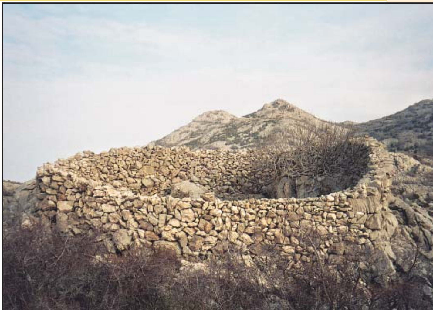
Slika 17. Mala ograda na primorskoj padini Velebita

njen zaštiti stoke. Sve su isključivo fortifikacijski defenzivne namjene.