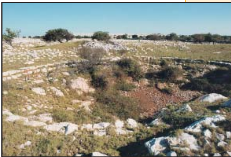
Slika 20. Obični tumulus na Kornatu