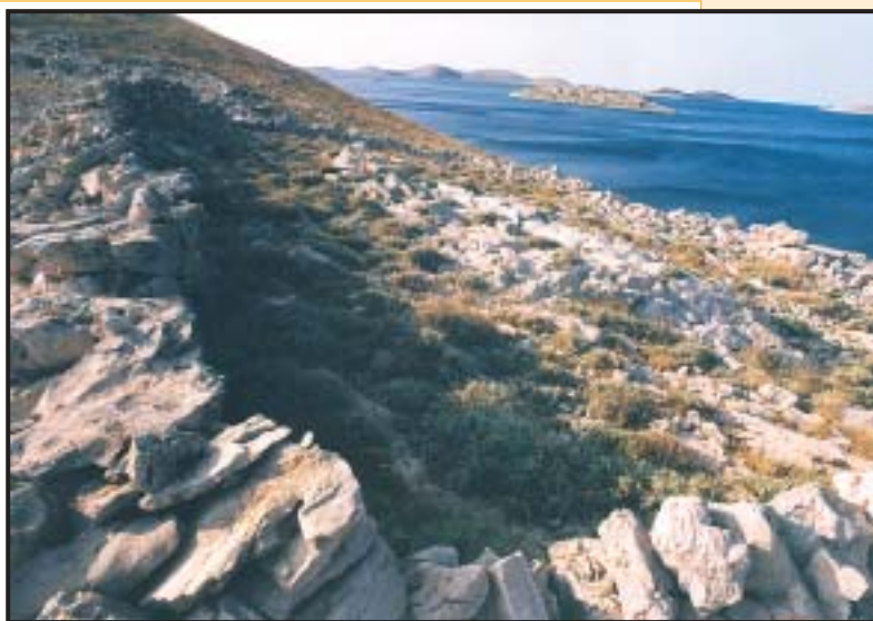
Slika 15. Mlađi »mali tor« nastao nakon 14. st.