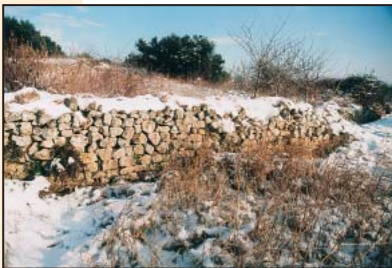
Slika 3. Zapušten, »bezrazložan«, nasipu sličan zid kod Vranskog jezera