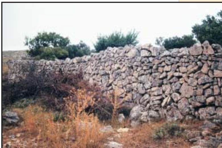
Slika 8. Zid s vijencem (tip 16)

14) Nazidani, naslonjeni (višestruki ili mnogostruki — obrambeni ili sanacijski) zid teško je po vanjskom izgledu razlikovati od prethodnog tipa. Tek u presjeku (na mjestima prolaza) ili na njegovu završetku uočava se njegova posebnost u načinu gradnje. U pravilu u njih je ugrađena golemo količina materijala, a sastoje se od više jednostrukih ili dvostrukih zidova, naslonjenih poput stranica knjige jedan na drugi. S obzirom na to da je nazidani zid uvijek viši od prethodnog tipa i zidan s mnogo više truda, svrha je njegove gradnje u namjeri da se rastresiti ma-