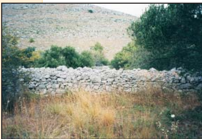
Slika 9. Nadzidani zid (tip 17) iz posedarsko-novigradskoga kraja