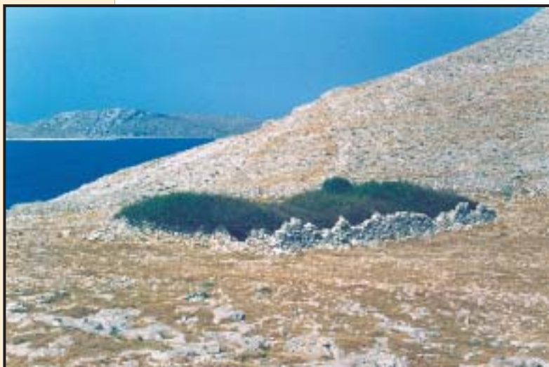
Slika 18. Ograde na Kornatu, unutar prostranog suhozidom ograđenog kamenitog pašnjaka