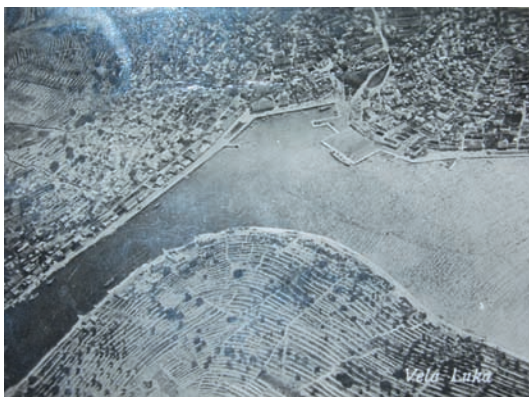
Stariji avio-snimak Vele Luke (30-te godine prošlog stoljeća)

Tehnika gradnje suhozida naslijeđena je iz starih vremena kao i svugdje na našoj obali. Kada se počelo s njihovom gradnjom ne može se sa sigurnošću ustvrditi. Sigurno je da je najveći dio sagrađen u 19. st. i početkom 20. st. kada je gradnja meja dosegla svoj vrhunac i kada je i broj