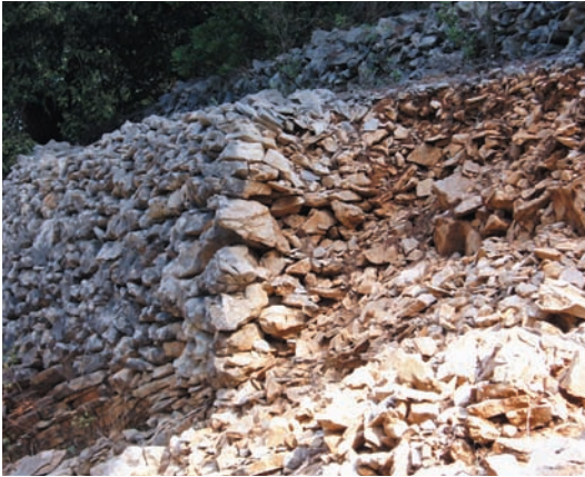
Srušena meja na kojoj se može vidjeti donekle struktura ili presjek

višak bi se slagao u gomile koje su počivale na "grizastom" ili stjenovitom, dakle nekorisnom terenu. Zemlja se čistila ili kako bi onda govorili "pula" do same stijene i na njoj bi onda počinjala gradnja meje . Za temelje su obično uzimani veći kameni, kao i za lice meje ili "glavaduru", kako kod nas kažu. U sredinu meje bi se »kopanjava« nabacivalo sitnije kamenje pa čak i mješavina zemlje te sitnog kamenja (tzv. savura) koje bi služilo kao vezivo. (Vidi skicu) Zemlja se sa očišćenog dijela ograde nosila kopanjava tako da možemo slo-