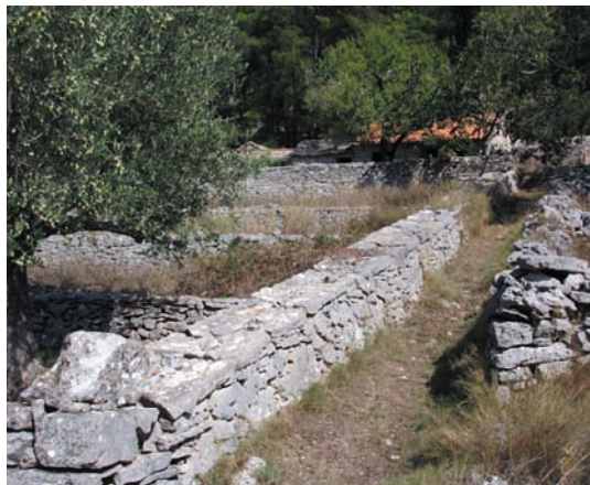
Meje u predjelu Pojica pokazuju vrhunac umijeća gradnje suhozida

Kamenje na prednjem i stražnjem licu meje je birano tako da se uklapa ili čak uklinjuje da bi meja bila čvršća i mogla podnijeti hodanje po njoj, a ponekad čak i natovarenu životinju. Po visini se u pravilu uvijek gradila s laganim nagibom radi stabilnosti. Vezivanje kamenja je tražilo umješnost graditelja. To nije svatko ni mogao, a ni znao raditi. Stariji se sigurno sjećaju pojedinaca, sada već pokojnika, koji su se isticali.