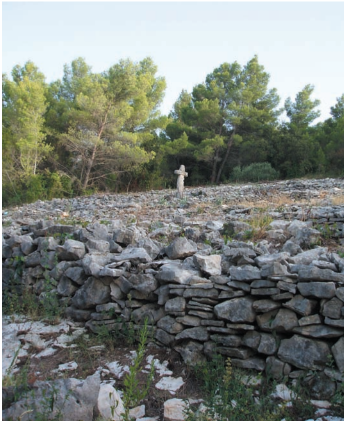
Na ovoj slici su čovjek, kamen i vjera sjedinjeni u skladnoj sintezi.

Kao što sam napisao u početku, ovo je svakako premalo štivo za nešto ovako veliko i važno, ali neka bude moj skroman doprinos sjećanju na sve naše pretke koji su iza sebe ostavili golem trud i veliko djelo. I da citiram pjesnika D. Tadijanovića koji je rekao: "Ja ću živjeti onoliko koliko budu živjele moje pjesme". Tako će i svi oni Ivani, Frankoti, Petri, Kuzme i drugi živjeti koliko budu živjele meje koje su gradili, koje su tu oko nas i oko kojih prolazimo, a da ih ni ne primjetimo. One će zasigurno stajati još dugo, onoliko dugo koliko bude i Luke.