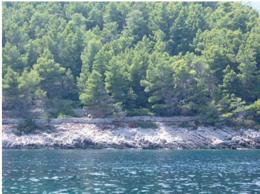
Meje u uvali Badnjena koje se spuštaju do samih mrkinti ili hridi

Meje su na blagim padinama, gdje je bilo više zemlje, pravilnije i veće, a što je teren bio grublji i strmiji to su bile nepravilnije, svedene na samo nabacano kamenje, kao da je i sam čovjek htio što prije pobjeći iz tog škrtog kamenjara. One su pri vrhu brda zaokruživale ogradice vrlo male veličine, ponekad tek nekoliko četvornih metara. Pokušavao se iskoristiti svaki i najmanji dio obradivog terena. Ljudi su se jednostavno prilagođavali terenu. U nižem dijelu brda ograde su šire i prostranije, veličinom dosežu "laze", a prema vrhu brda, što je teren siromašniji