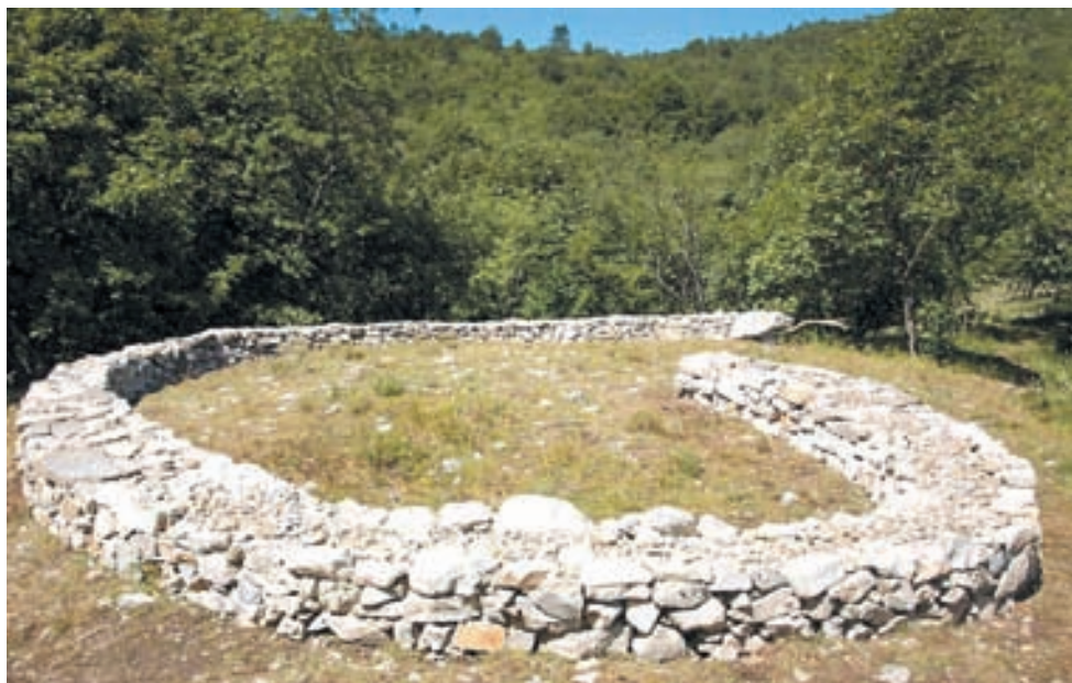
Dvadesetak studenata izgradilo je suhozidnu "zmiju" na Mitsko-poučnoj stazi