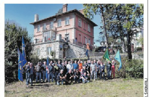
Veliki odaziv na akciju u organizaciji UDVDR-a PGZ-a

RIJEKA » Još jedan projekt koji je dobio potporu Riječkog programa lokalnog partnerstva realizirana je ovog vikenda – članovi Udruge dragovoljaca i veterana Domovinskog rata Primorskogoranske županije i njihovi prijatelji uredili su prostor ispred zgrade Centra za psihosocijalnu pomoć stradalnicima Domovinskog rata na Zametu. Riječ je o projektu nazvanom »Branitelji za branitelje«, a obuhvaća je uređenje okoliša, ali i parkirališta i prilaza zgradi koju koriste i ambulante Doma zdravlja. (NL)