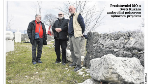
Predstavnici MO-a Sveti Kuzum zadovoljni potporom njihovom projektu

Obnovljen će biti prostor nekadašnjeg stočnog sajma gdje će biti natkriveni prostor površine oko 15 metara četvornih, a uređeni će biti i suhozidi oko ovog prostora