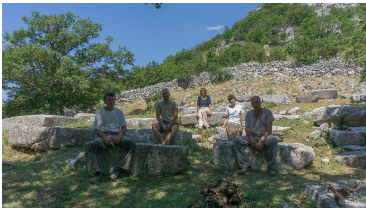
Photo: Artisans et volontaires faisant la pause après la reconstruction d'un mur de clôture entourant une église médiévale et son cimetière protégés par l'UNESCO – Konavle 2019