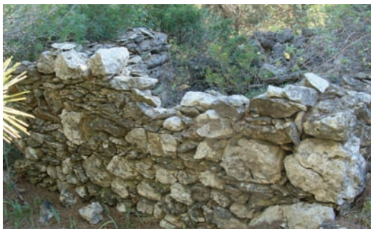
Staro kutišće od prin 300 god. (Pinski rat)

nagrađene većinom do prin 200 godišć. To se poklapja s početkum velikega rijenja dedrinta, po Dovernim bandama, po brigima, uglavnemu na prostorima di još ni bilo do tadar rijeno.