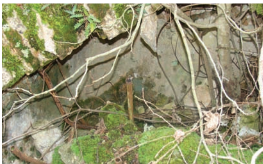
Ostaci jadro stare gustrine (Torac)