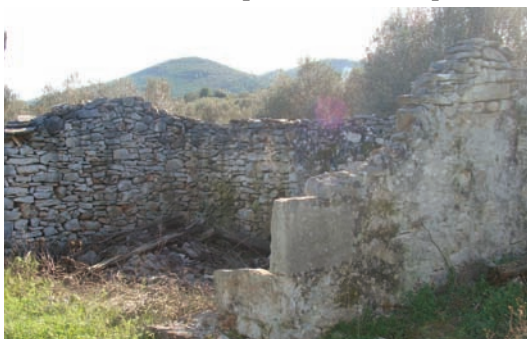
U ovu kuću jih je puno stalo (Gudulija)

Ko je to nadoživi s nostalgijum i jubavi gleda danas na ta kutišća u kojima je sprove teške dane, ali da ni bilo njih, kud bi? Te dane su Lučani živili svakako gore nego su to recimo živili prin 2-3 hiljade godišć naši pridhodnici Iliri u ovake slične kućice, ali s većim kunforum i s obilatim jićum.