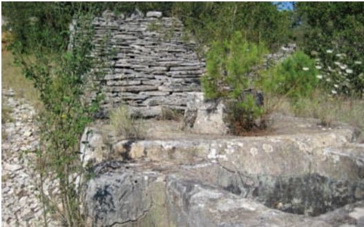
Naplov, gustrina i vintrijolač (Oboja glava)

U nediju se i za svetac ni rilo nego se ostalo u Luku. Tako je to duralo do jematve, jer su tadar došli drugi posli, a i ni se moglo rit po dažju.