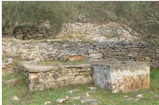
Gustrina i vintrijolač (Vrbovica)

U kuću se držalo i suhu travu. Tun je sta i alat za kovanje. A u kuću su stale i druge potribe, jer bi kabilo došla i cila famija fatigat oli sprovest dan digo liti, pa se tun parićavalo za što go izist oli prinoćit. Tadar bi žinske malo uredile okolo kuće, usadile cviče u jarule i to obično svesvete, pa modre i bile arcize, lale, jubice, vijole, čunkeje idr. Starije žene bi usadili trave za širup, pogotovu rutu, dešpij, dusmarin.