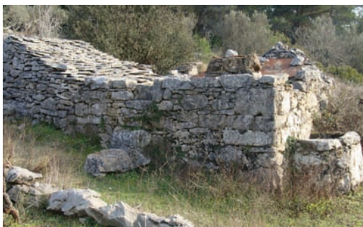
Naplov, gustrina i vintrijolač

Otkago postoji Luka, a to je od prin ništo više od 200 godišć, rijenje je bilo nika vrst ulaganja u opstanak famije. Digo se rilo gora, a digo stare ograde. U prvu su rili sva braća od jedne famije.* Naravno socum. Taka ekipa od 6-7 jake čejadih mogla je tega izrit jadno puno. Odeka od temu ni rič, pa ćemo to priskočit za jednu drugu temu.