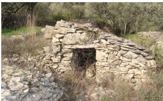
I teza je u ratu dobro došla

a ni tišćit, varit rakiju, ni kupovat, ni hodit u crikvu, ni poč u likara, ni putovat. Sve što se dogođalo bilo je u te male kućice i oko njih.