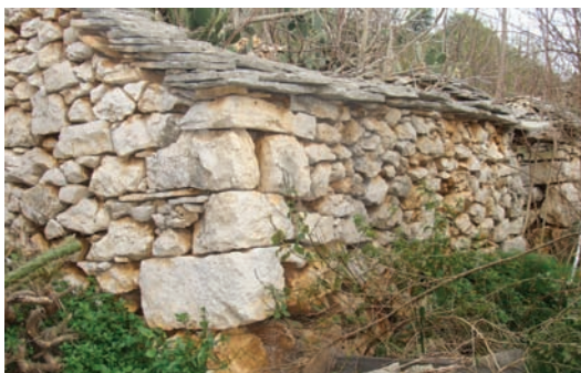
Kantuni su stabili

Tukalo je još parićat ploče za pokrit, pa učinit rožnjike, planju i podboj. Pločah je bilo di su tanje pole, koje bi se unaprid stile dezbando dokli se rilo. A moglo jih se donit od digo inđi. Za rožnjike i planju ni bilo trudno nač jer je okolo bila gora i borje. A što se tiče podboja un je moga bit i od dugega pločastega kamena, a i od min-dela oli smokve, samo ga je tukalo