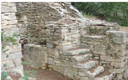
Kutišće, gustrina i vintrijolač (Badnjena)

Na zemju, koja je već lanik izrivena dobro je uspiva kupus, skalonja, a znalo se o stajuni stit i koju pomadoru, kukumar, kumpir... Kruh, uje i kvasina su done-seni izdoma, a moglo se nač i vina. Undar bi kogo iša u kuću parićat obid. Kad bi