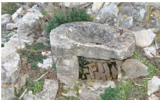
Vera na pucalu

Ostalo je još da se dodaju okolni miri do visine bulte i u ti prostor na volat pupuni s grubim manjim kamenima i paka po temu stu ploče s malo paste. Valo je za uspet se na bultu učinit i jedne male skaline, a na misto di je osta otvor pucala tukalo je nadogradit i stit veru. Iza tega valo je s konalicama spojiti da voda od naplova pada na bultu, koja bi kroz 2-3 buže na pucalu hodila u gustrinu. Da ne ulize koja beštija kroz te buže stavilo bi se u njih bokun suhe zelenike oli vrisa. Još je valo