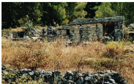
Stara kućica za uteć isprid dažja (Sprtišća)

A i u druge stajuni zna je past dažj dokli se fatigalo. Osobito su bile opasne nevere za one koji nisu imali kućicu za spremit se. Ako bi se parićava dažj i počelo digo largo grmit, valo je nabrime uletit u kuću i čekat što će bit. Tadar se isto unilo sedlo i tipanjce, bulse, dvanjke, alat i drugo što se ni smilo smokrit. Jedino se ogotu ostilo u ograda koja