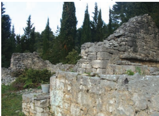
Ostaci stanih Grizunovičah (Kovnici)

Uz kuću je osim gustrine i vintrijolača bilo još tezah i štalah za živo, koze, kokošinjac, a za zahod je služi ograđeni handuč, koji je bi malo podaje i u kojega se stalno navržiiva šušanj. (Kogo je uža stogo učinit i od dasakah). Na drugu bandu je bilo učinjeno za oprat se, a malo daje fugun za štogo ispeć. Sve skupa je ovo bilo povezano s velikanim dvorum po 20-30 metrih. U dvor je bilo obično veliko stablo od mindela, a iza kuće trstika, slive i kojigo čempris, koji su odavali iz larga da se tun žive.