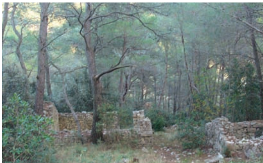
Kutišće u gori di se stalo u ratu (Vrbovica)

Kuće vanka su užale uvik dobro doć kad se u prošlosti u mistu događala velika nevoja i ni se moglo stat doma. To je bilo najviše u doba svitskih ratih, oso-