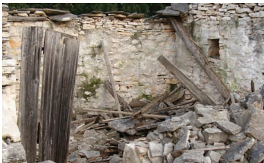
Još se vidu rožnjici i vrata

bila kakago štala za tovara, undar di je stala koza, pa ništo kako handuč, pa ograđeno di se loži za varit vanka. A i sami okolni pristup je alavija nagrađin i bi srediñ..