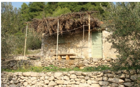
Šator od češvine ispid kuće

Ako se kućica gradila di je strmo, undar je tukalo ispid kuće podignut meju