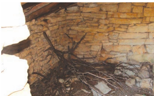
U kućicu se je našlo i drva za užeć oganj

Najviše priko godišća u Luku dažji zadnjih misecih i u proćuliće. A to je baš kad je vanka najviše posla. U jesen je jematva i branje maslinah, gre se u drva, šušanj, grudu, gnjive..., a opet u proćuliće se kopa, sije, posal po lozju... Po cile dane se fatigalo i bilo vanka. Sad, ako je već ujutro dažjilo, ni se hodi- lo niđi. Ali većinum bi bi poče dažj dokli se fatigalo.