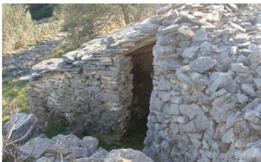
I teze su dobro došle (Pinski rat)

U takemu svakodnevnim trudu i štroliganju, kućica di bi počinuli, bila jim je dnevni boravak, u bilo koju doba godišća. Posebno je bilo lipo doživiti liti, dokli čvrški kantaju, a justa se šušu,