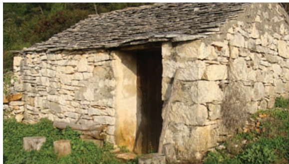
Tipična stara kućica (Sprtišća)

Uz taku kuću još se da vidit nika građenja. Bit će tun