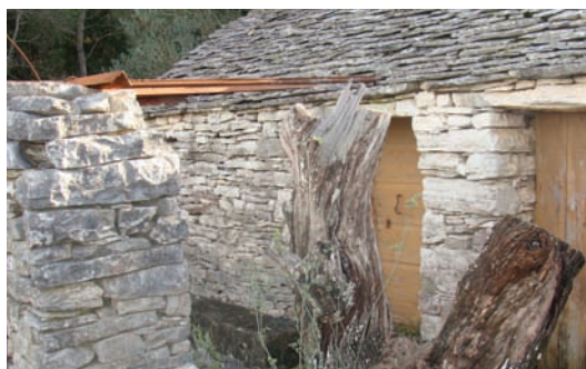
Tun se ostavalo (Badnjena)

A za leć bi se unutra stilo po klehu cmija, kojigo tipanjac od ogote, brnjal, štogo stare robe, štogo soto za podglavu, a za pokritse stari sukleni lancun i u svoj robi bi se leglo. Cilu noć bi gori velikani tapaj oli bija, dokli je u jednu punistricu u miru gorila ulenica. Ujutro se je rano diglo, pojarilo oganj, svarilo širup, izilo dvi-tri smokve, poteglo gucaj raki-je i odma išlo na fosu rit. Za izist štogo priko dana bili bi donili kogo iz Luke štogo zlicum, osobito sočiva i slanah, a digo se i tamo parićalo, jer su i žene znale doć priko dana ubrat paše i sl.