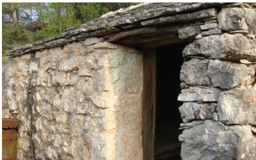
Podboj od drva (smokve)