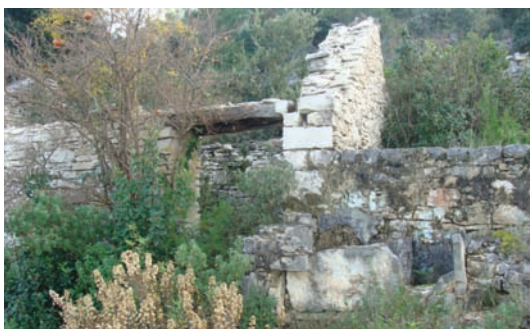
Podboj od kamena

Dunkle bili smo rekli da digô se puno rilo oli di je bilo puno lozja, tukalo je imat kakugo kućicu. Obično 2x3 m, ali i veću. Isto tako uz kuću je valo izdubat gustrinu i do nje učinit vintrijolač.