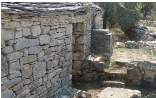
Dvor di se frajalo (Njivica)

U temu, svak je odgovara za svoje jiče kojega je čini, pa su digo i pale kritike, više radi smiha. A slako bi znalo lipo ispasti pa se svo izilo. Vina ni falilo, a voda u gustrinu je, već smo rekli, bila studena.