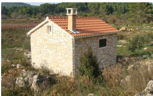
Današnja kućica vanka (Sprtišća)

Vaja bit realan, jer danas digo su ceste i može se doć sautum, di se može dopremit matrijal kaki se želi, kad je tehnika građenja toliko usavršena s makinama i matrijalum da to gre brzo, di je struja, voda i kanalizacija cine, undar je podignut pravu modernu kuću, koju zovu vikendica* moguće svakemu koji zarađije. To se danas čini uglavnemu uzamore, po valama. Svak hoće komod i moderno živjenje i uživanje, pogotovo novi, mladi naraštaji.