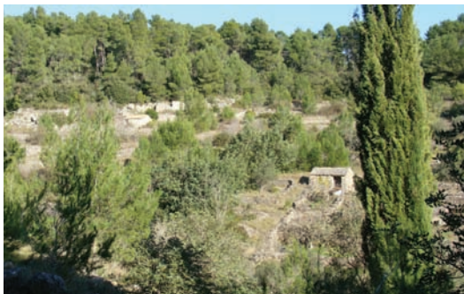
Ostaci prošlosti (Žuvan dolac)

I dokli gledamo danas okolo kutišćah krcato arcizih, modrih i bilih, duplih i injulih, pa puste modre i bile lale, svesvete, čunkeje, jubice... znamo da tun više niko ne dohodi . A unde di su te kućice garnirane su po malo betuna, kupah, plastike, salonita ... senjal je da digo još tun kogo dođe .