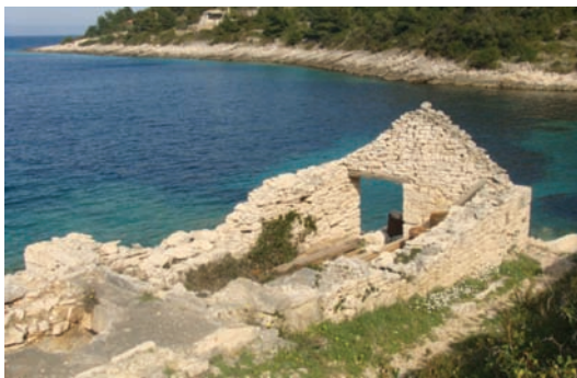
Kutišće ribarske kuće u Stinivu

Tako recimo dedrinta i u Dovnje bande ritko je bila koja težaška kućica u samu valu, oli na puntu, kako recimo danas. Ako je bila, undar je bila jadno mala i to više radi gustrine. To je najviše služilo za lozje tundaska, ali i za digo liti kalat se namore za poč se okupat oli prinoćit koju noć.