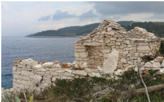
Kutišće ribarske kuće na puntu od Parihonje

Po noći, ako ni bilo miseca, kogo bi iša u kosmaće s lućum oli feralum. A undar ujutro rano se išlo lovit na črviće. Lovilo se «na kopje» od trstike i to na