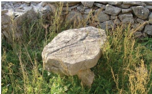
Ploča - trpeza u dvor (Potirna)

Valo je vazest ogotu oli tovara i prima dogovoru odniti sobum što tribuje. Koju staru teću i još koji sud i malo pošade. A što se tiče hrane tamo je tukalo parićati hrstule, pogače, koju pršuratu valo je obavezno svariti zeje, a undar ispeć malo ribe (ritko mesa, jer je bilo skupo).