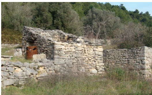
Kutišće di se stalo u ratu (Vrbovica)

Tadar su čejad od straha bižali iz mista i živili u bilo kake kućice vanka i nastane. Tadar su one male, mizerne kućice bile dom za cile famije. Tun se ni stalo na jedan, dva oli tri dana, nego na misece. U taku malu kućicu užalo je stat 5-10 čejadih. I starijih i dice. A ako je bila veća kuća oli nastan, undar je tun stalo više famijah, više nego je bilo moguće. To zato jerbo se smatralo da je to za niko vrime, za kojigo dan, pa da će se čejad vratit doma. Ali visti, koje su dohodile iz Luke, nisu davale nadu za to, pa bi se tamo ostajalo misecima. Do iscrpjenja, jer ni bilo