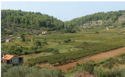
Kućice u Vrbovici danas

Svrimum će to sve počat u povist oli nestat, a nadvladat će nove moderne vikendice do kojih će hodit ceste i po njima auti. Sve što se temu nađe na putu i bude zasmetalo, bit će zbuldožerum izbrisano iz lica zemje i nestat u betunu.