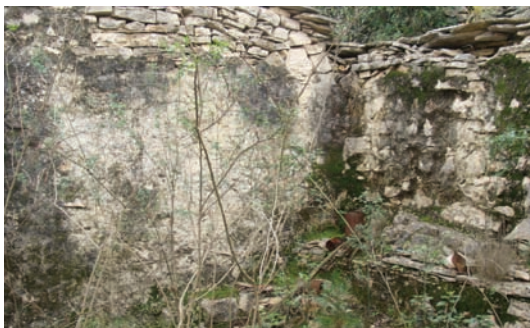
Unutrašnjost prostorije di se spalo

drugo što je bilo. Bilo bi se štogo i zakopalo i pobralo. U ove kućice se i rađalo, a i umiralo.