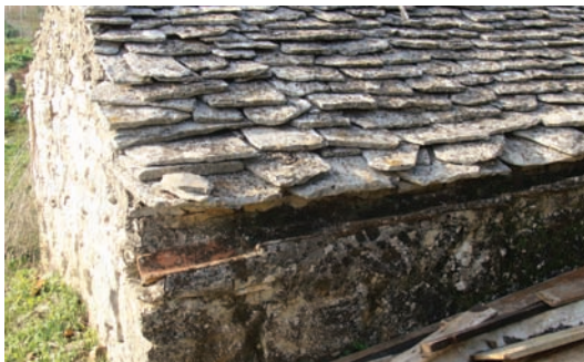
Konal za vodu iz naplova za gustrinu

Na kraju bi se po pločama poškropilo malo vode da se vidi jeli digo teče. I tako je kućica bila parićana za u nju stat. Istina, tukalo je stit vrata, pa unutra digo inkartat, što je ovisilo od temu