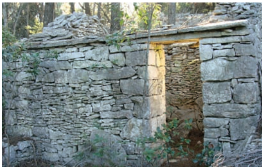
Ode je bilo lipega kamenja (Oboja glava)

I sad je još samo vajalo pokrit. I tun je tukalo to učinit po zanati, neka je u to doba kobilu zna pokrivat spločama. Najprvo je valo stit kotale . To su one velike ploče, koje su morale prihćat vanka mira najmanje 10 cm, da voda ne gre u mir. Oni su tako činili strihu . Daje, na kotale su došle isto velike ploče, a pun gore sveto