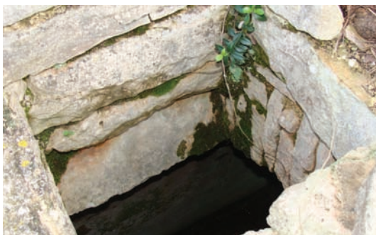
Pucal od gustrine di se vidi volat i pleća

Za iskopat, recimo metar dubine, valo je izahvat kojugo polu i po mogućnosti nač kakigo kotac, da voda bude studenija. U ono doba isto se užalo minat i to ščrnim prahum, ali to je valo znat kako učinit da mina ne izvrže vanka kroz bužu, pa ništa ne bi diglo.