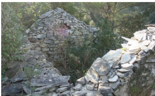
A ode unutra sad reste grmjje