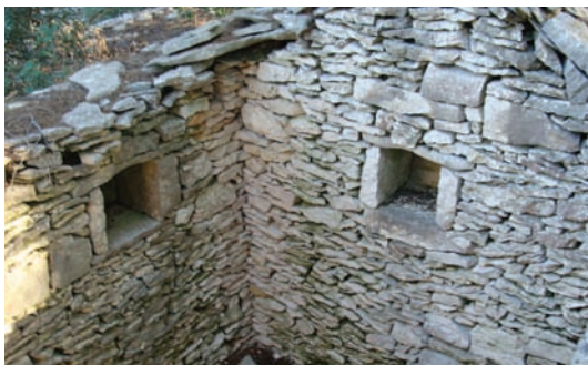
Punistrice iznutra (Oboja glava)

ali niki vlasnici su jedan put prominili rožnjike pa možu durat još toliko.