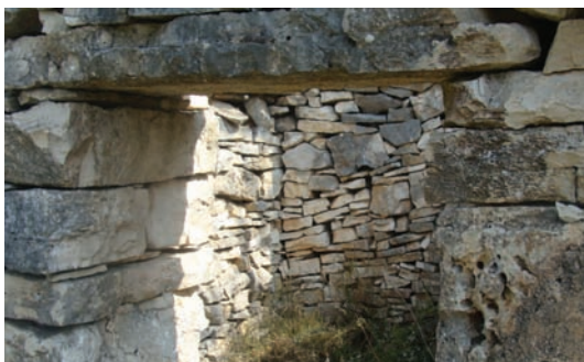
Postavjeni podboj na vrata

zašto će služiti, jeli za stat oli samo držat travu, alat, robu i sl. Kasnije se unutra uređivala prima potribi.