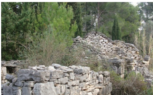
Ostaci jednega stana

stvari pojma „vikend“. Ali ritki su stari stani doživili vrime vikenda. Zato su ostavljani a počeli su se graditi moderne kuće tzv vikendice, većinom uzamore.