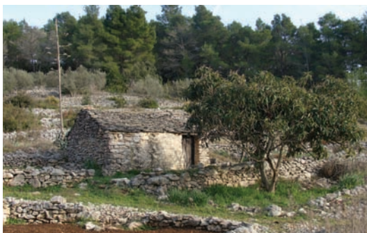
Ode se dohodilo u fraju (prima Torcu)

U ono doba poč u fraju znaćilo je organizirat izlet u čigovu kućicu vanka i tamo parićat za jist