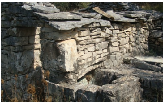
Ode više ništa ne služi

Prid kuću bi se i rasprtilo oli naprtilo živo, a za to je valo imat i alavija uređeni put do nje, koji se obično kalava goreka iz glavnega puta. U kuću se prisvucalo za fatigat. Kad bi se rasprtilo živo, dvanjke i burse bi se stilo unutra, jer se u njih držalo ono što se donilo iz doma za izist i popit i čuvalo se da ne izidu beštije do obida. A kad dođe obid tun bi se išlo potoplit vaporić i lipo na komodu izist i malo počinut.