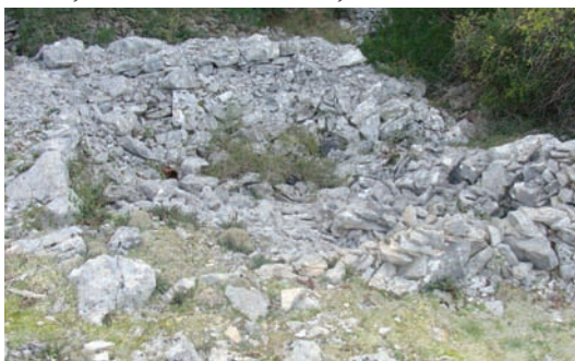
Ostaci kutišća pastirske kućice od prin 300 god. (Torac)

Gustrine su tadar bile ritke, osim unde di su bili stani oli di se držalo stoku. Tek undar s početkum trapjenja nove loze, došla je potriba za polivanjum svintrijolum i tadar su se počele gradit gustrine i uz njih vintrijolači. A to su pridjeli uza Dovernje bande, dedrinta, a i svukud di je largo bilo lozje, a što su već gradili Lučani.