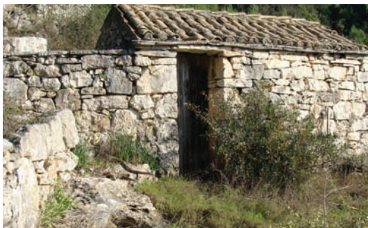
Ode se frajalo (Žuvan dolac)

i pit i nakon tega kantat i smijati se. To je ustvari bilo druženje, oli prijatejah, oli prijatejicah, a i mišano društvo. Jer takega druženja po Luci ni bilo nego je valo hoditi vanka.