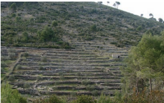
Kućica di je prin bilo lozje (Vela strana)

Digô se, kad gremo vanka, uputimo sautum, oli još boje ako gremo nanoge po starima putima, ukazat će nam se livo-desno po koja stara kućica, oli kutišće.