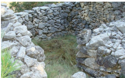
Staro kutišće od prin 300 god. (Žuvan dolac)