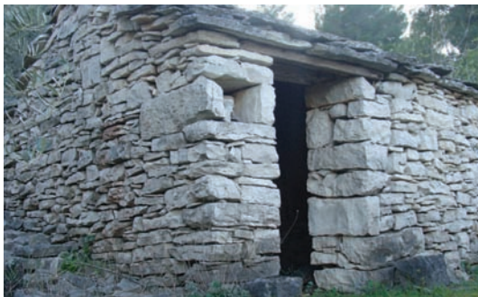
Ode se moglo uteć ispid dažja (Strmena)

Tako stisnuti u kućicu, gledalo se i slušalo strahotu od dažja, vitra i groma. Čutilo se niku sigurnost, koju je davala ta mala kućica od kamena usrid nevoje. Svukud okolo riče voda a unutra je lipo i suho. Digo je, ako je došlo svitrum,