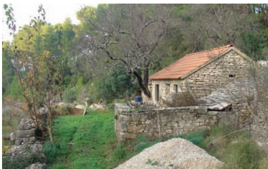
Jedan još živi stan (Preturov privor)

To je bi gust. Largo od doma. Živit oskudno, ali ništa ni falilo. Ritko bi se hodilo u Luku. Samo da se dobavu kojego potrebe, a undar opet nazad. Priko dana se štogo i fatigalo, jer se moglo nač što činit. Još ako je bilo okolo lozje, masline, trap, pa ako se stilo šaku boba, biži.