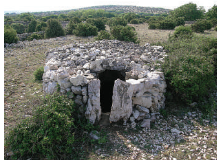
Škalica (stupi) na ulazu u nenatkriveno predvorje draškog bunara Semjuni.

Škalice se koriste gdje god je nužno omogućiti prolaz ljudima, a zapriječiti ga stoci. Na Krku su najljepši primjer takvog rješenja draški bunari , suhozidni spremnici za kišnicu kakvi se koriste izvan naselja. Budući da je voda u bunaru namijenjena za piće samo ljudima, građevina u pravilu ima tijesan ulaz, škalicu, koji sprečava pristup ovcama.