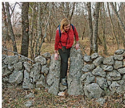
Ova škalic (8.) je vrlo "user-friendly" (hrvatski: "prilagođena korisnicima")...

Od Skrbčić valja najprije krenuti neasfaltiranom cestom na jugoistok. Prva škalic je uz njezin desni rub, oko 700 metara od početka "makadama", a stotinjak metara nakon odašiljača mobilne telefonije. (Ne, neću navesti GPS koordinate lokacije – prošetajte potpuno "klasično", otvorite oči i um.) Put od prve do desete škalice je dug tek 1.2 km, pa se bez žurbe može preći za dvadesetak minuta. Naravno, ako se putem zabavite fotografiranjem škalic, što vjerojatno hoćete, šetnja može potrajati i tri puta dulje, no i to je još uvijek najviše jedan sat.