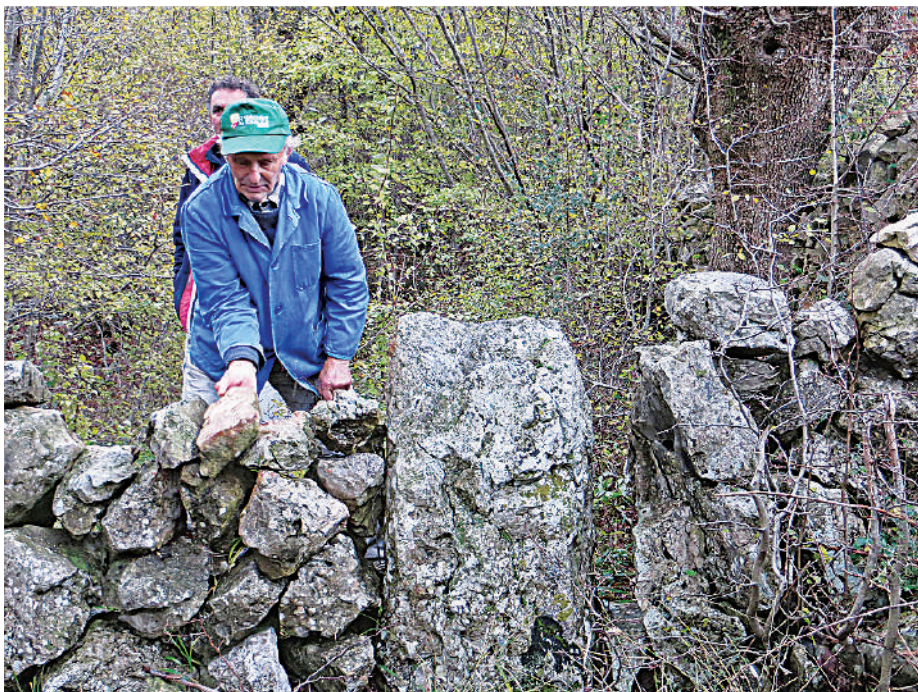
Savjesni Barba mi nije dao da slikam 10. škalicu dok on ne poredi gromaču s čijeg se vrha bilo odronilo nešto kamenja. (29. studenog 2014.)