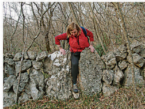
... ali poneke od njih (npr. ova, 6.) baš i nisu udobne za svakoga.